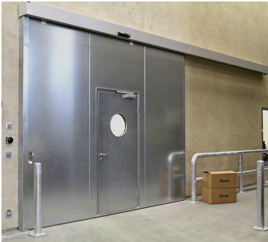
Bild 1: Das neue schnelllaufende Feuerschutz-Schiebetor von Tortec eignet sich hervorragend für Bereiche mit hoher Durchgangsfrequenz wie zum Beispiel bei Übergängen von Verkaufsräumen und Lagerbereichen oder von Küchen zu Gasträumen.

Der Vorteil von schnelllaufenden Feuerschutz-Schiebetoren ist, dass man als Planer keine Rücksicht auf Türfallen, Schwenkbereiche, Türhöhen, rechte Winkel etc. nehmen muss. Die Tore können auch mit Nischenwänden verkleidet werden. Der kraftvolle Antrieb erlaubt hohe Geschwindigkeiten und einen ruhigen Lauf.