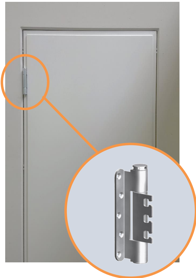
Abb. 1: Überfälzte Feuerschutztüre STU-1 inkl. hochwertigen 3-D Federband