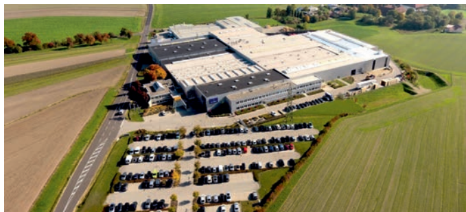
Tortec Brandschutztor GmbH - Wolfsegg Oberösterreich

Tortec setzt auf modernste Produktionstechnik. In seinem Werk in Österreich garantieren computergesteuerte Bearbeitungslinien maßhaltige Elemente mit perfektem Sitz aller Beschläge und Funktionsteile.