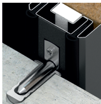
Stumpf auflaufendes Schiebetor EI,30

Diese Torausführung ist die Alternative zu 2-flügeligen Drehflügeltüren im Objektbereich, z.B. in Eingangsbereichen. Da das Tor im Einlaufbereich nicht in ein Profil sondern stumpf auf eine Wand läuft, entsteht eine hochwertige Optik und der lichte Durchgang wird verbreitert. Wird der Abstellbereich als Nischenlösung mit Nischenklappe ausgeführt, ist das Tor nahezu unsichtbar. Die Sicherheit wird durch Edelstahl-Einlaufbolzen, Dämmschichtbildner und Gummidoppeldichtung gewährleistet. Stumpf auflaufende Tore erhalten Sie in einer Vielzahl von Oberflächen-Ausführungen. Eine exklusive Pearlgrain-Oberfläche eignet sich besonders für die Anwendung in Lagerhallen und hochfrequentierten Bereichen.