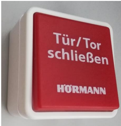
Hörmann Drucktaster „Zu“ Aufputzmontage