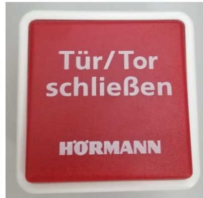
Hörmann Drucktaster „Zu“ Unterputzmontage