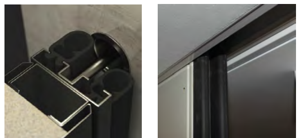
Bild 6+7: Sicherer Schutz im Brandfall durch 2 Spezial-Feuerschutzdichtungen am Torblattende