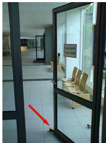
Bild 2: 2-flügelige Feuerschutztür ohne Feststellanlage, Offenhaltung mit Holzkeil

Mit Feuerschutz-Schiebetoren ohne Einlaufprofil von Tortec können Planer nun "offene" Brandschutzabschlüsse bei offener Architektur realisieren.