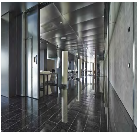
Bild 3: Durchgang ohne "Engstellen" FST - stumpf auflaufend in Nische - offen

Download Texte und Bilder: www.tortec.at