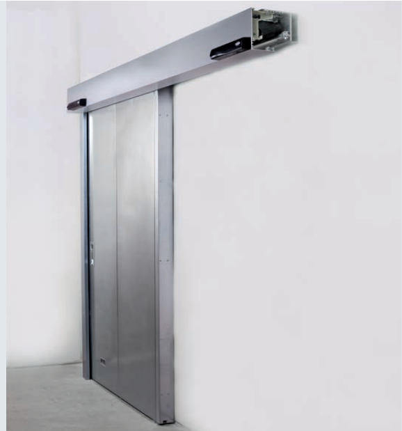
1-flügelig, ohne Schlupftür