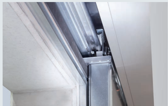
Wandseitiges Labyrinthprofil mit Brandschutzlaminat