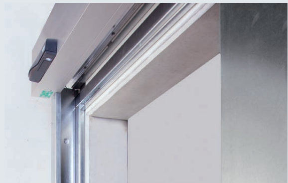
Einlaufprofil und Hauptschließkanten-Absicherung