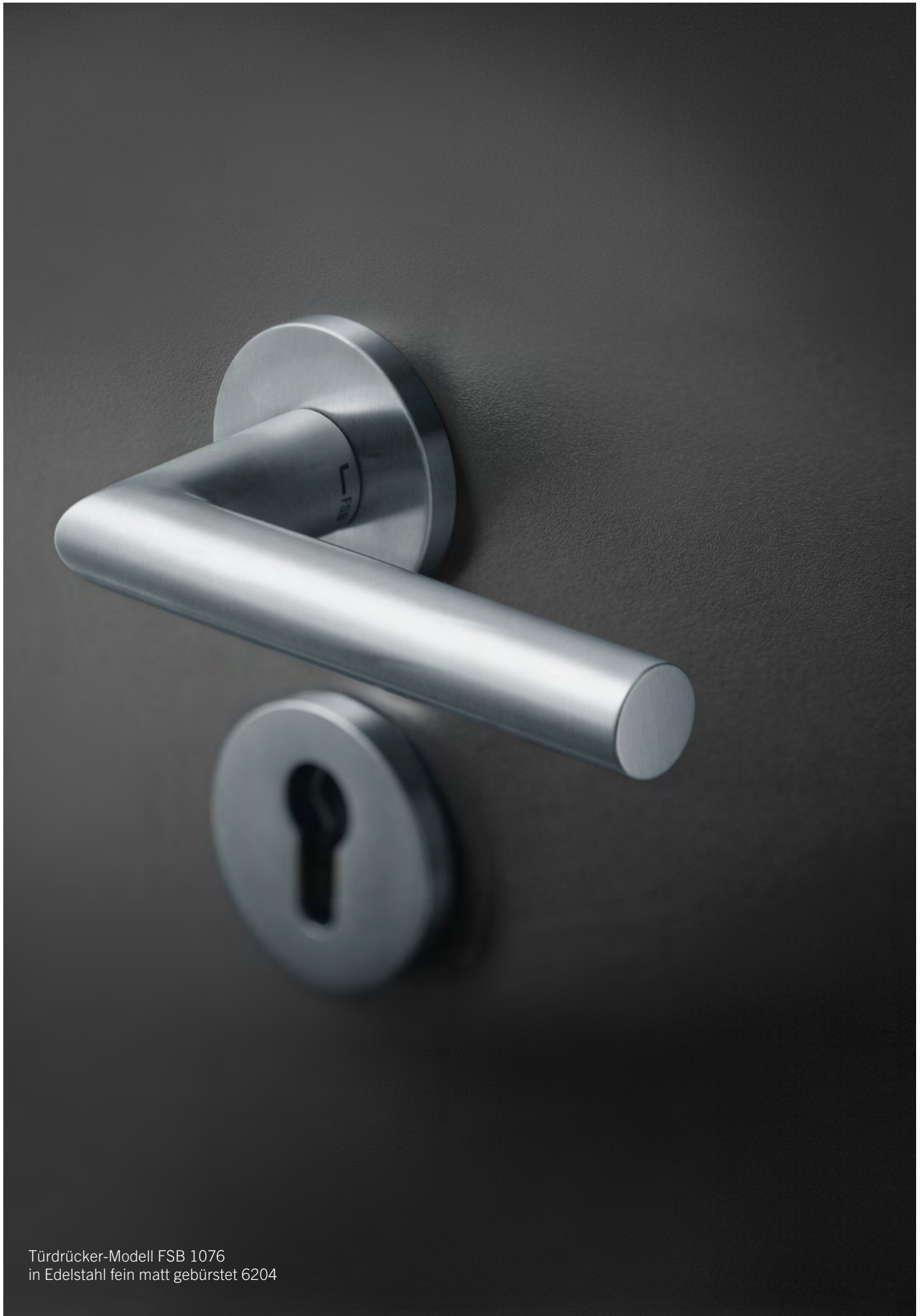
Türdrücker-Modell FSB 1076 in Edelstahl fein matt gebürstet 6204